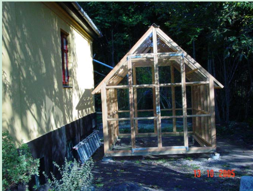
Drivhus i Lærketræ på husets sydside

vest. Karens Hus administreres af Kulturhuset Bispebjerg Nordvest med funktion som anneks hertil.