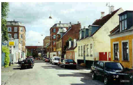
Thoravej v/Provstevej Den røde gavlr er bygning med gendarmene Hjørnehuset med tårnet skal i fremtidens ses

Tekst og rutelægning: Christian Kirkeby, Lokalhistorisk Selskab 2009.