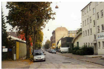
Rentemestervej set mod Provstevej Tekno Legetøjsfabrikken var th. set Peter Ipsens Alle.