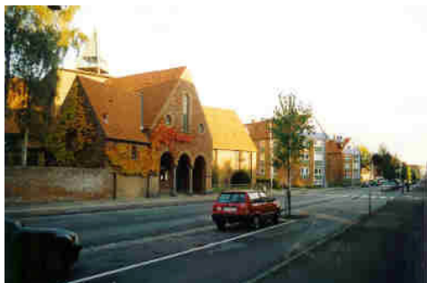
Mågevej med Ansgarkirken

Tekst og rutelægning: Chr. Kirkeby, Lokalhistorisk Selskab 2009