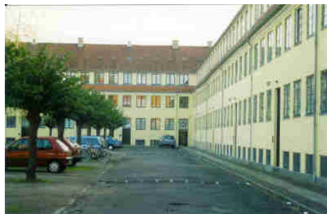
Det gule Palæ på Vestergårdsvej.